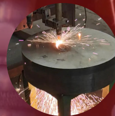
Corte por Pantógrafo