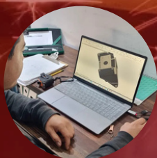
Diseño y réplica de piezas mecánicas