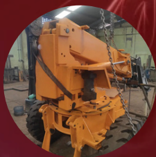
Mantenimiento a maquinaria industrial