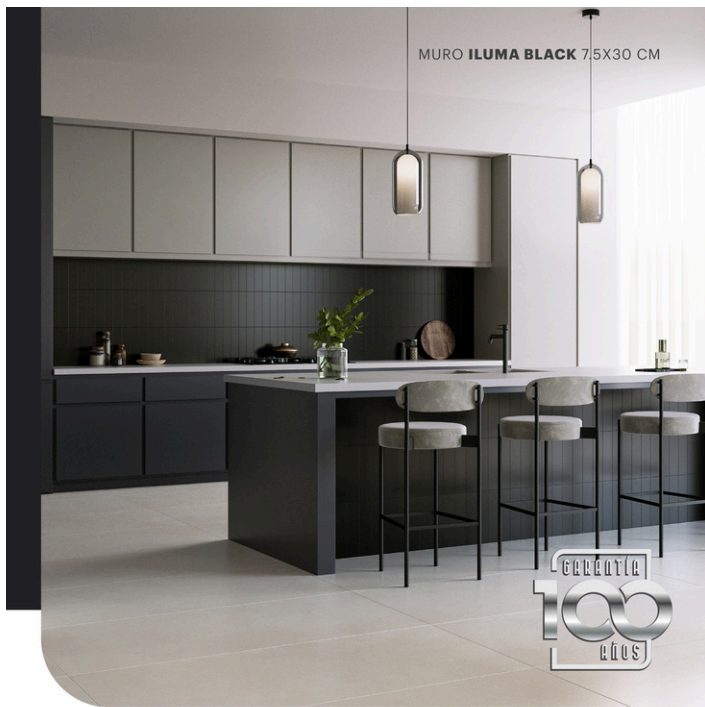
MURO ILUMA BLACK 7.5X30 CM

cel. 618 158 8180 arq.adrianagn@gmail.com