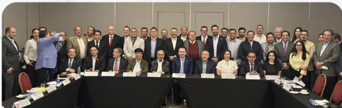
Reunión con Sindicatos

El Presidente Nacional de COPARMEX, Juan José Sierra Álvarez, participó en una Mesa de Diálogo Sindical con diversas cámaras empresariales, sindicatos y federaciones de todo el país, en la cual reafirmaron su convicción de que el desarrollo de México se construye mediante entendimiento, corresponsabilidad, colaboración y compromiso entre quienes conforman el sector productivo del país.