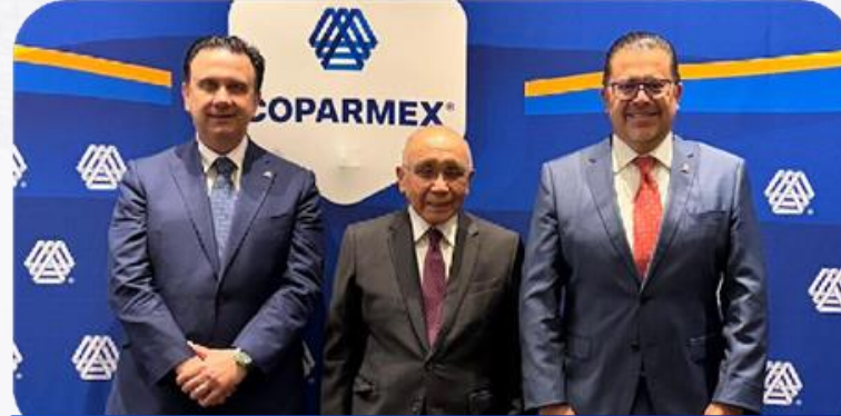
Reunión con representantes de socios directos

Dentro de las empresas participantes se encuentran Nacional Monte de Piedad, Ruba Llegaste a Casa, Red Ambiental y Quálitás.