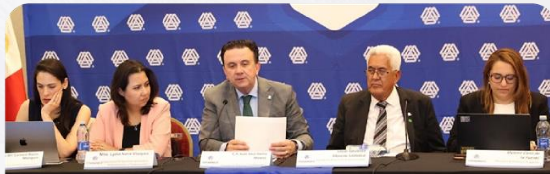
Reunión de presidentes y directores

Dicha reunión fue útil para abordar temas nacionales relevantes y el diagnóstico de los principales retos que enfrenta México. Este espacio permite el diálogo institucional y el intercambio de ideas.