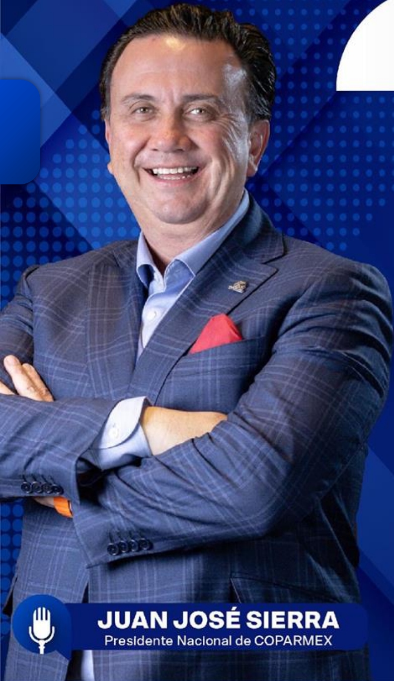
JUAN JOSÉ SIERRA Presidente Nacional de COPARMEX

Reafirmamos y estamos de acuerdo y apoyamos el combate a actividades ilícitas, pero ese combate a actividades ilícitas debe realizarse, precisamente, con pleno respeto al Estado de Derechos, asegurando reglas claras, proporcionalidad y mecanismos de control que eviten abusos.”