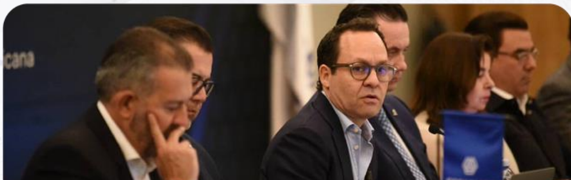
Sesión de Consejo Directivo