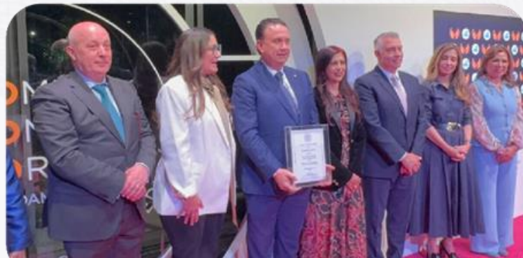
Premio WEF Iberoamerica

Durante la conversación, se destacó que hoy generar empleo e inversión ya no es suficiente: es fundamental construir una narrativa que conecte con la ciudadanía, fortalezca a las instituciones y aproveche el momento histórico que representa el nearshoring para México.