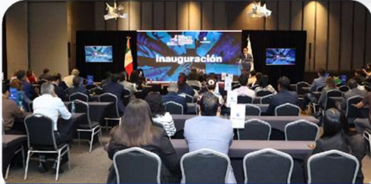
Foro de Impacto Social 2026

Se llevó a cabo la inauguración del Foro de Impacto Social 2026: Empresas que trascienden en valor económico, humano y ambiental, en donde el Presidente Nacional de COPARMEX, destacó que la Responsabilidad Social Empresarial ya no es un discurso, sino una inversión estratégica que genera impacto real, medible y sostenible.